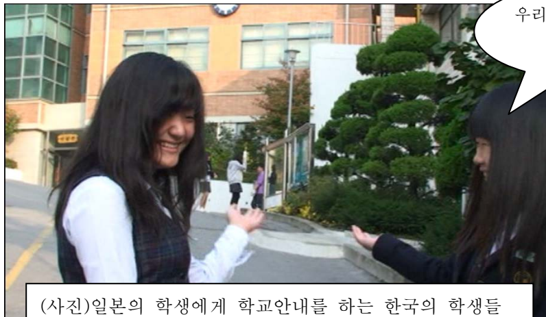
(사진)일본의 학생에게 학교안내를 하는 한국의 학생들