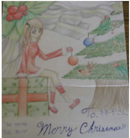
(사진) 한국 학생으로부터 온 크리스마스 카드