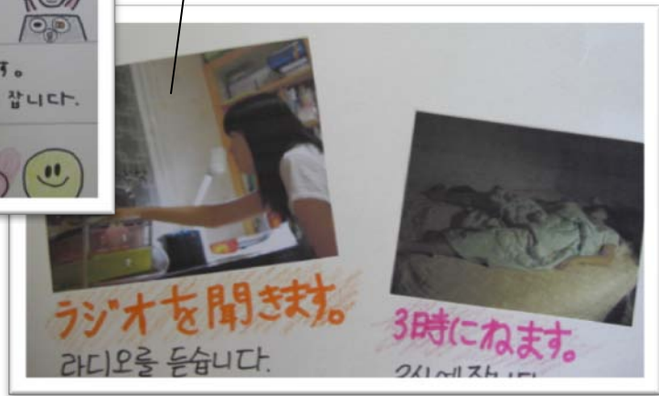
한국학생이 만든 자료예

몇시에 일어나고, 몇시까지 공부하고, 몇시에 자는지...? 서로 시간을 물어보자