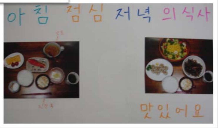
日本の生徒が作った資料例