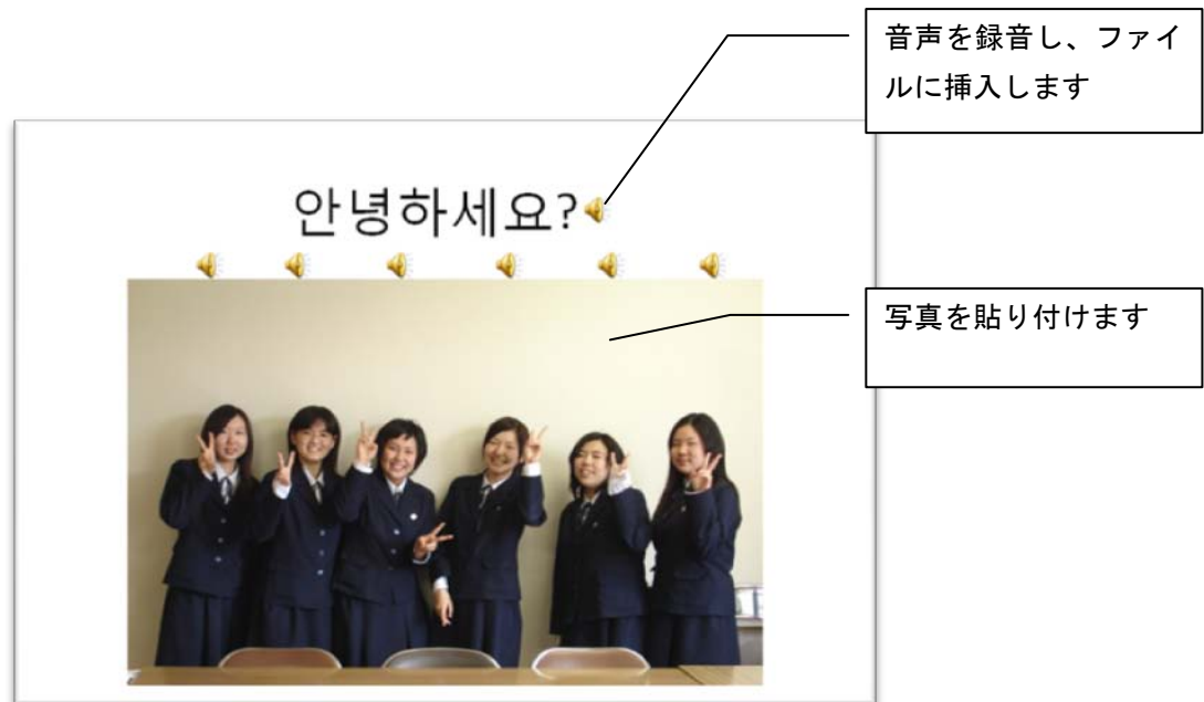
日本の生徒の自己紹介ファイル例