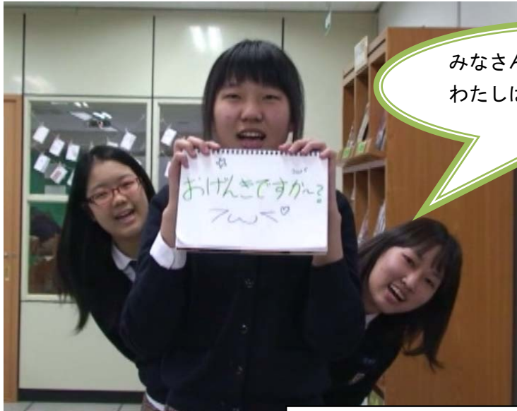
韓国の生徒のビデオレター例